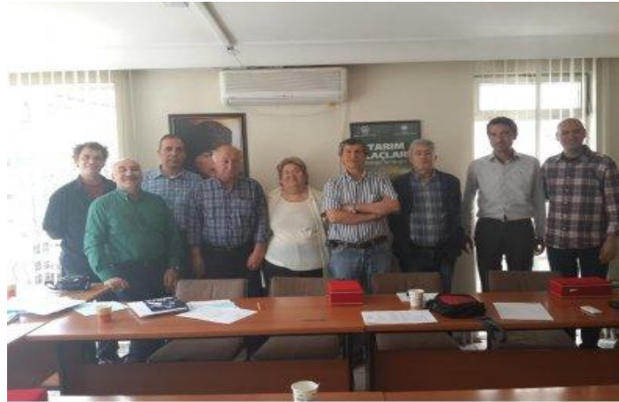
KMO 43. DÖNEM KURUL ÜYELERİ İLE ORTAK TOPLANTI